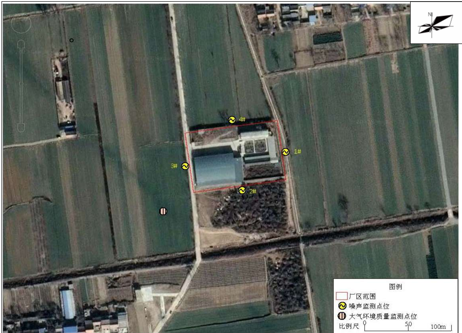
附图 4 项目监测点位图