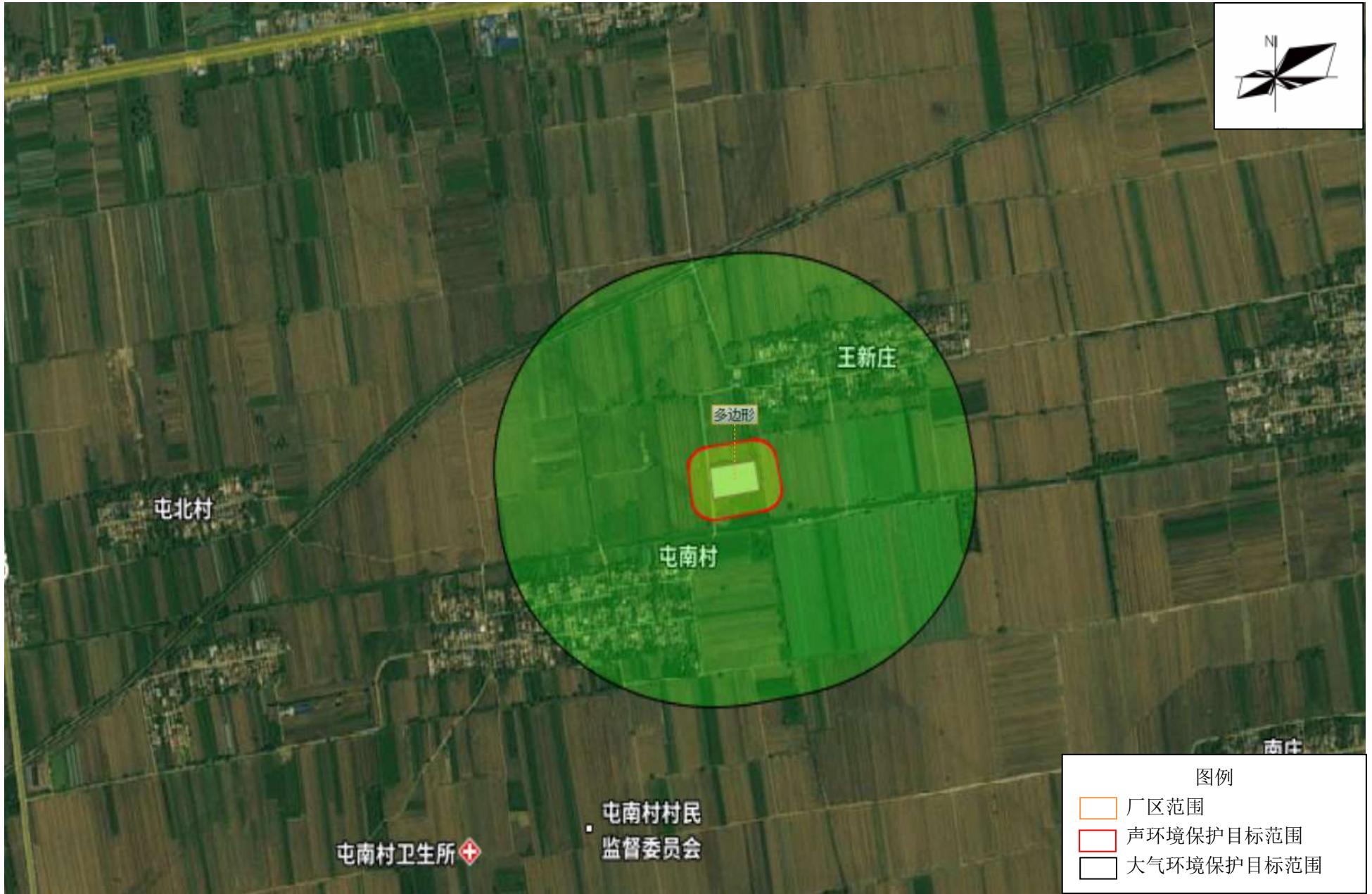
附图 6 环境保护目标分布图