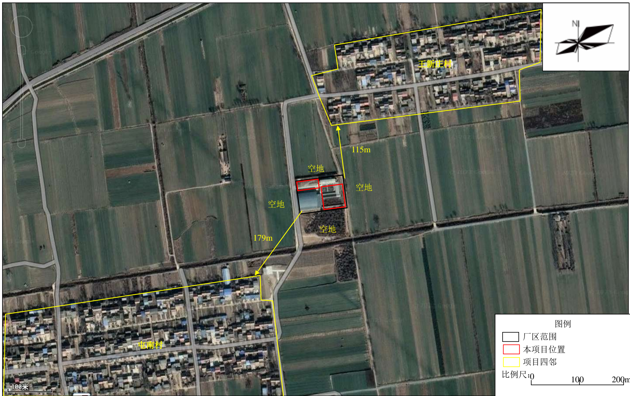
附图 2 项目四邻关系图