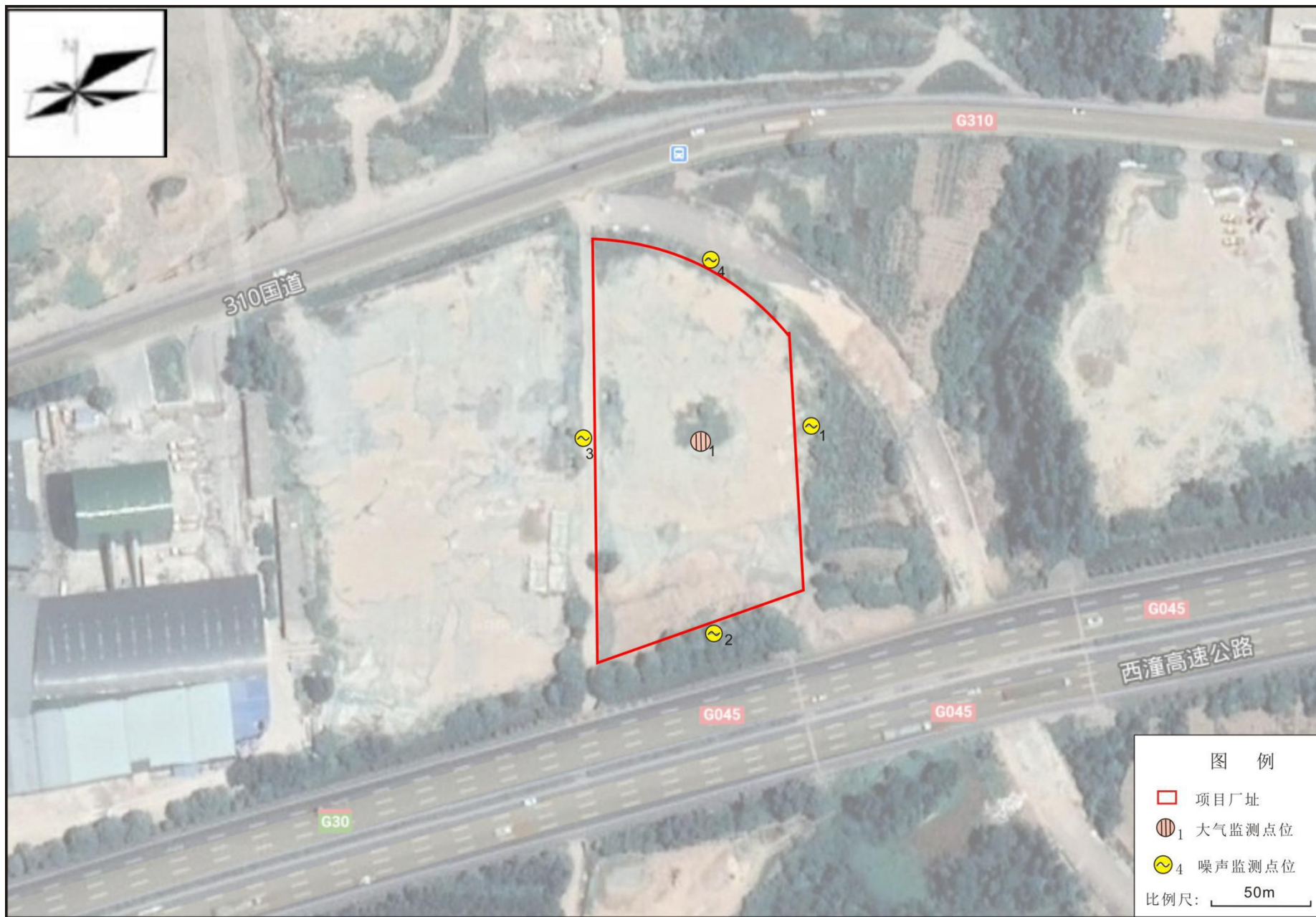
附图5 监测点位布置图