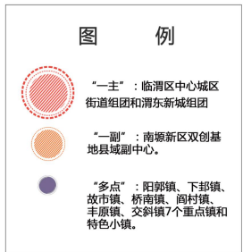
图 4-2 城镇空间布局图